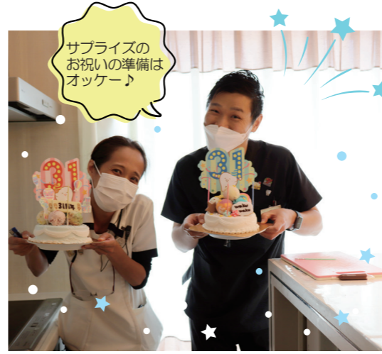
サプライズのお祝いの準備はオッケー!

先月の6月8日、ヨリタ歯科クリニックはおかげさまで31周年を迎える事が出来ました。前日からお祝いの準備は万端! 訪問チームが診療終了後、病院に戻る途中でアイスクリームケーキを購入。そう、31周年の31をかけて、サードティーンアイススクリームでケーキを予約していたのです!