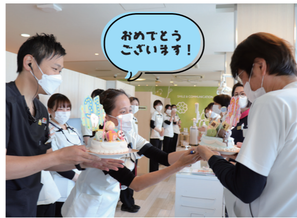
おめでとうございます!

お祝い企画メンバーが当日の早朝からアイススクリームケーキにデコレーションしてきました。どんとんと気温が上がってきた頃なので、アイスケーキの溶けていくスピードが早いこと! 皆で焦りながらも完成。バックヤードでお祝いの準備のため、アイスケーキにろうそくを立て火をつけて、ソワソワしながら待機しました。もちろん、お祝いの事は院長には内緒のサプライズです!