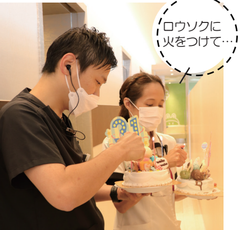
ろうそくに火をつけて...