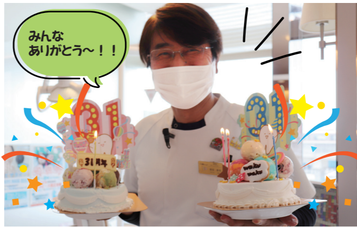
みんなありがとう!!

お祝い企画メンバーが当日の早朝からアイススクリームケーキにデコレーションしてきました。どんとんと気温が上がってきた頃なので、アイスケーキの溶けていくスピードが早いこと! 皆で焦りながらも完成。バックヤードでお祝いの準備のため、アイスケーキにろうそくを立て火をつけて、ソワソワしながら待機しました。もちろん、お祝いの事は院長には内緒のサプライズです!